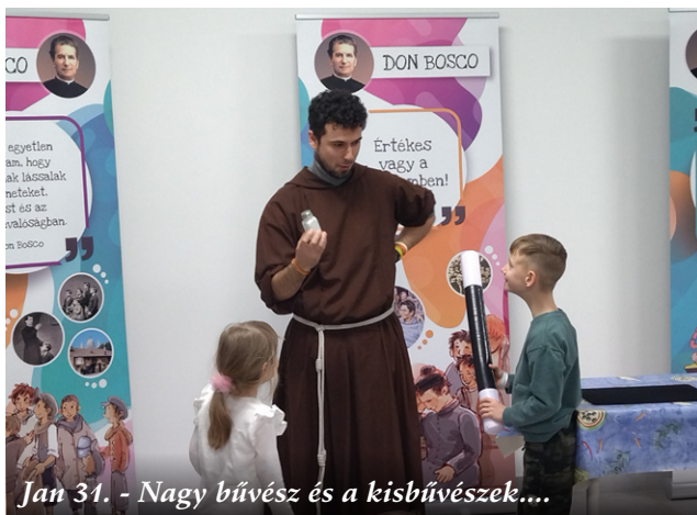
Jan 31. - Nagy bűvész és a kisbűvészek....