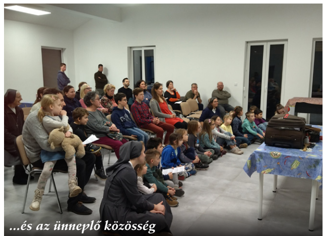
...és az ünneplő közösség