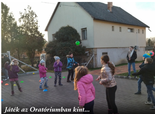
Játék az Oratóriumban kint...