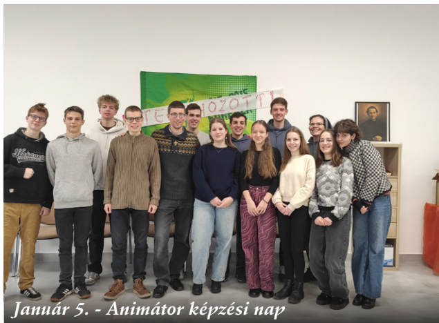
Január 5. - Animátor képzési nap