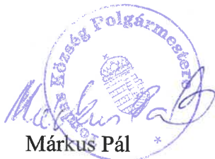
Márkus Pál polgármester

Ez a rendelet 2025. január 31-én lép hatályba.