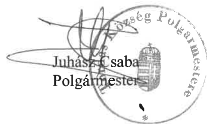
Juhász Csaba Polgármester