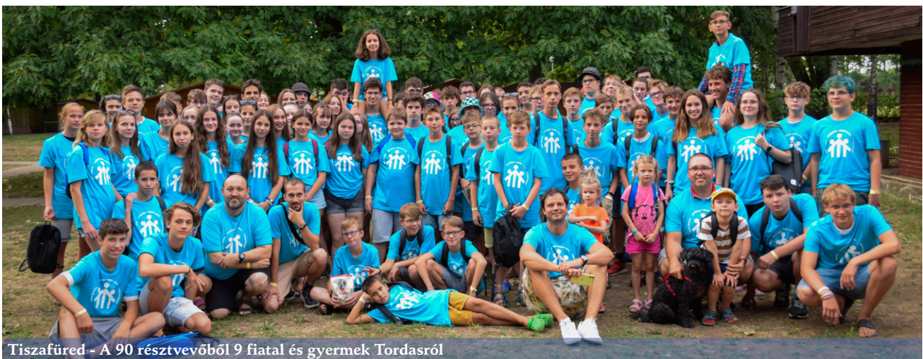
Tiszafüred - A 90 résztvevőből 9 fiatal és gyermek Tordasról

A nyár véget ért, de szeptembertől ismét minden szombaton, délután szeretettel várjuk a gyermekeket és a fiatalokat az Oratóriumba!