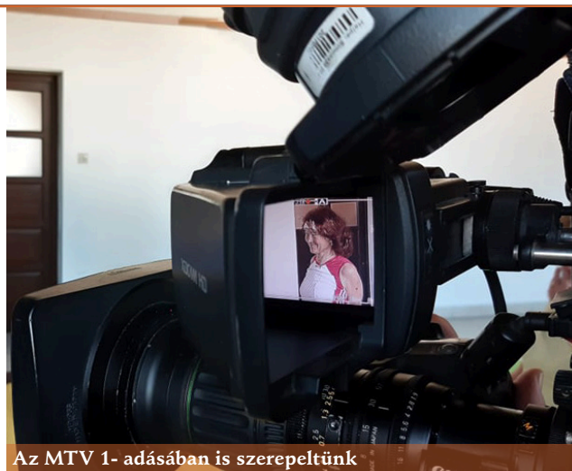
Az MTV 1- adásában is szerepeltünk

Ha mindehhez rendszeresen erősítünk is, a has- és hátizmok megmunkálásán keresztül már nagyon sokat tettünk azért, hogy hátfájásunknak, illetve a lumbális és nyaki gerincszakaszok deformitásából adódó egyéb panaszainknak búcsút inthessünk.