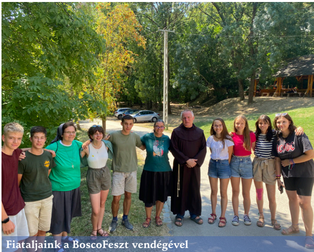
Fiatalkaink a BoscoFeszt vendégével