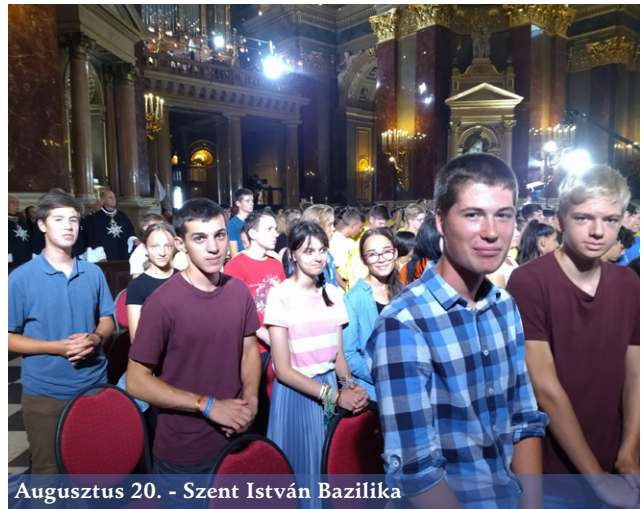
Augusztus 20. - Szent István Bazilika

strandolás, és strandröpi mérkőzés. Érdekes előadások is voltak, az egyiket Böjte Csaba tartotta, aki néhol megfogható, máskor éppen vicces dolgokról mesélt.