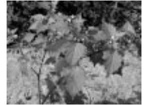
Fekete ebszőlő (Solanum nigrum)