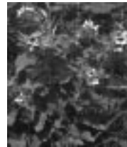
Beléndek (Hyosciamus niger)