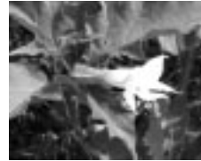
Csattanó maszlag (Datura stramonium)