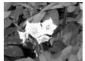
Burgonya (Solanum tuberosum)