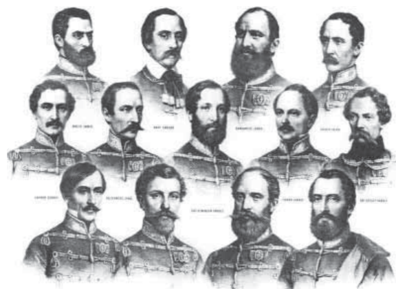
Lázár Vilmos (főtiszt, ezredes), Gróf Dessewffy Arisztid (tábornok), Kiss Ernő (tábornok), Schweidel József (tábornok), Lovag Poeltenberg Ernő (tábornok), Török Ignác (tábornok), Lahner György (tábornok), Knezić Károly (tábornok), Nagysándor József (tábornok), Gróf Leiningen-Westerburg Károly (tábornok), Aulich Lajos (tábornok), Damjanich János (tábornok), Gróf Vécsey Károly (tábornok)