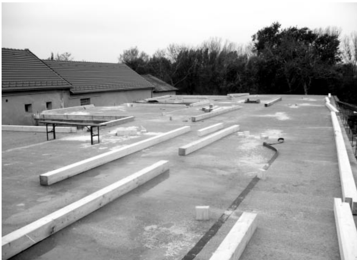
Megérkezett a tetőhöz szükséges faanyag, így már csak az időjárás múlik, milyen gyorsan készül el a tető (november 9.)