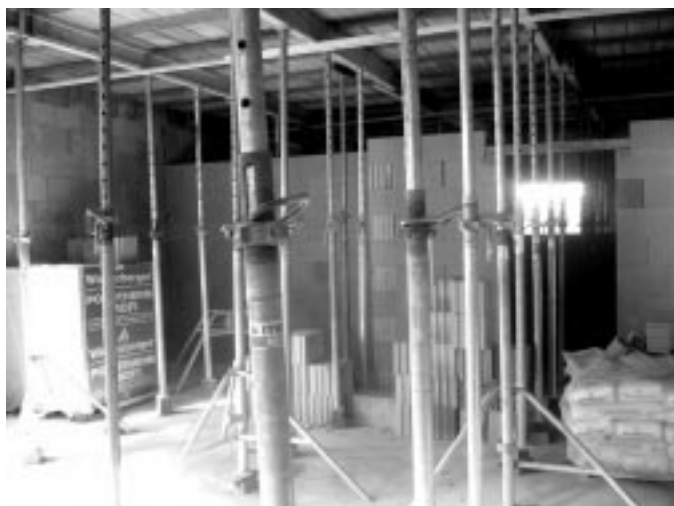
A válaszfalakat a födém alátámasztásának elbontása után tudjuk befejezni (november 9.)

Látogassa Ön is az „Új ovink lesz!” blogot az interneten!