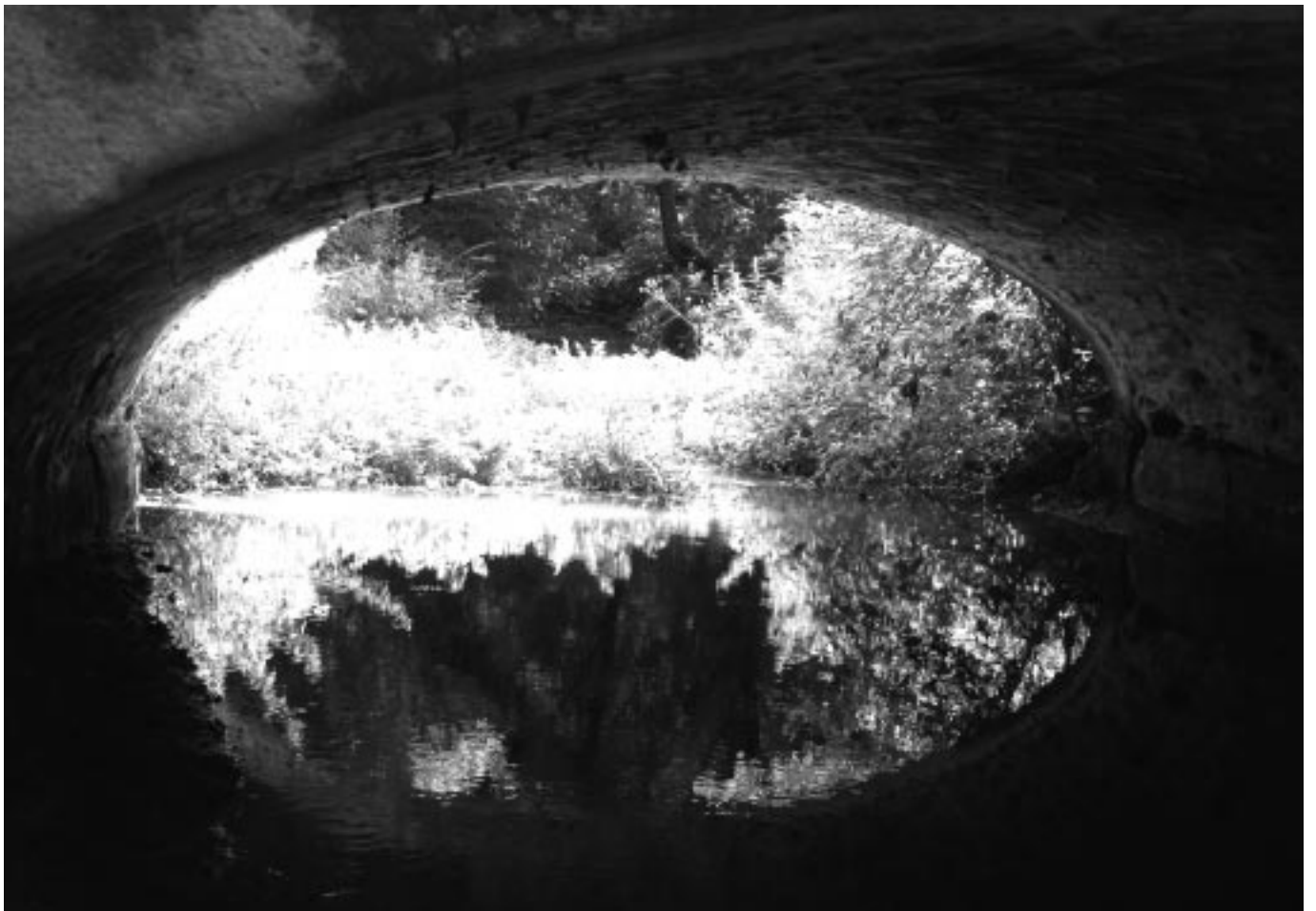
Különdj: Bohár Tamás (5 000 Ft)