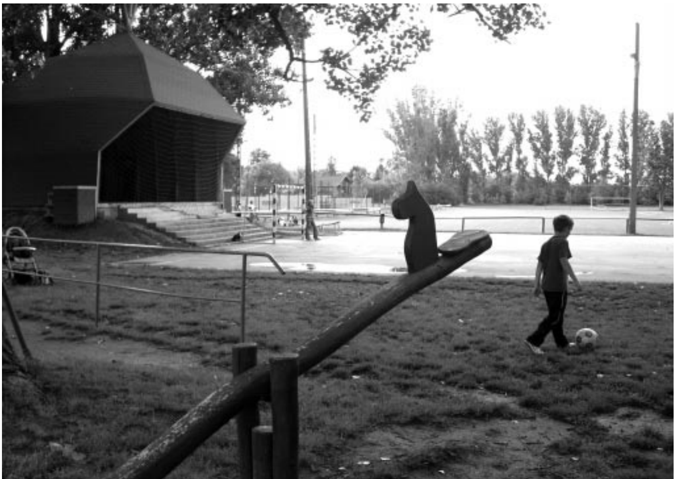
Különdj: Szakter Anikó (10 000 Ft)