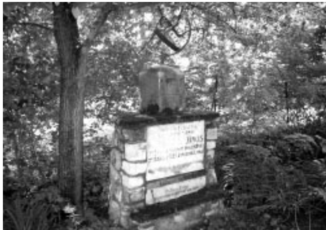
III. helyezett: Szakter Anikó (10 000 Ft)