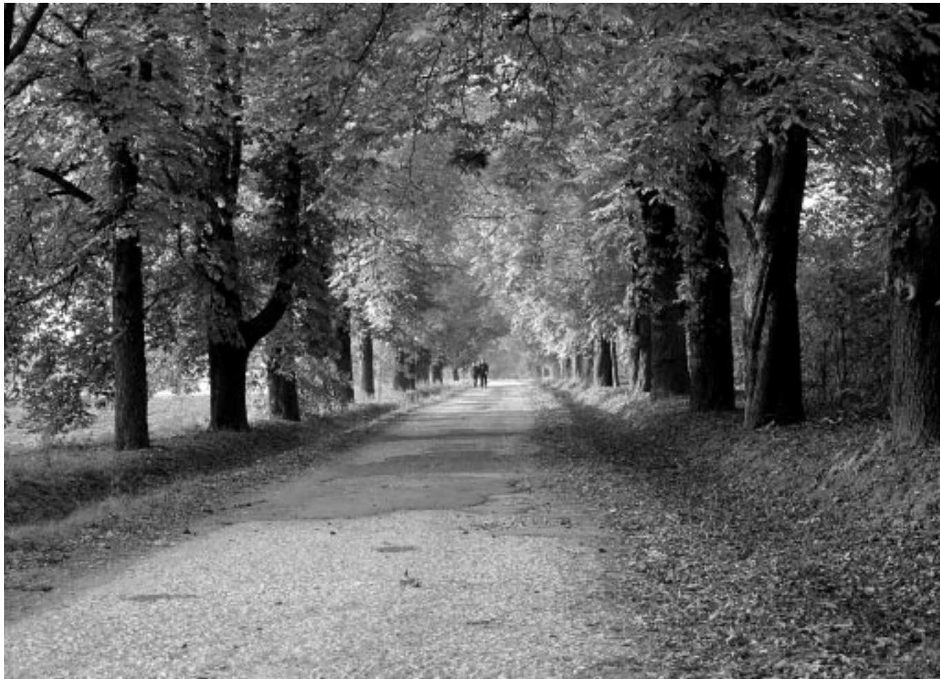
I. helyezett: Boka György (20 000 Ft)