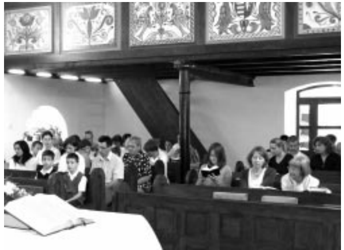
Tanévnyitói istentisztelet a gyúrói református templomban