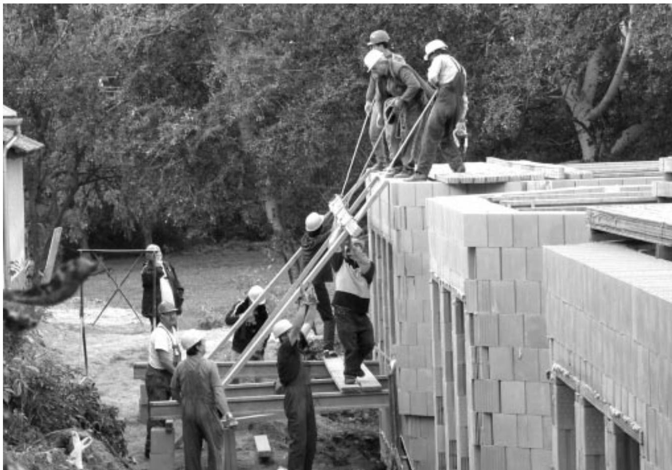
A pincefödém építése (szepetember 8.) után egy hónappal, már a földszinti födém építésénél tartunk (október 11.)