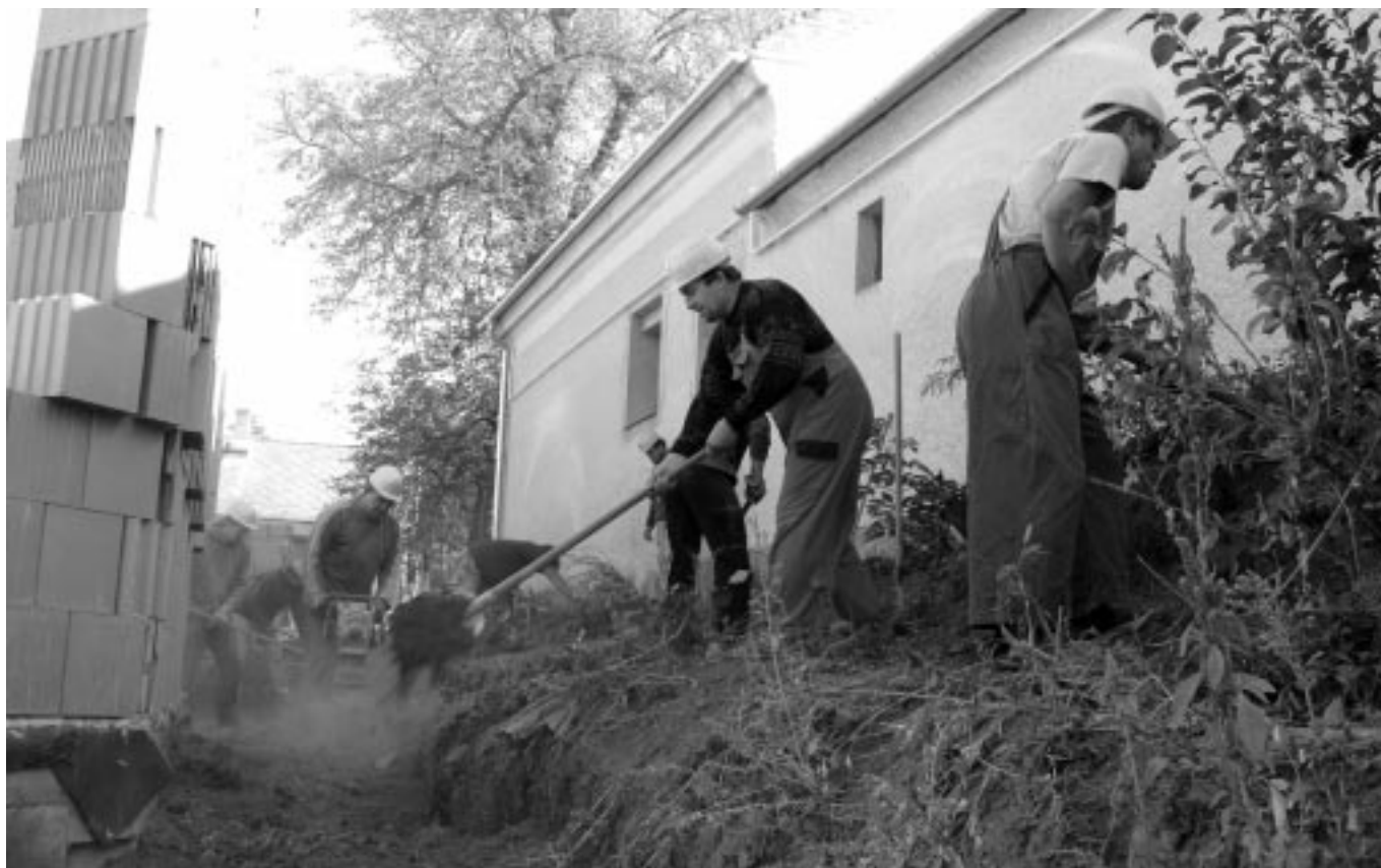
Október első hétvégéjén már a tereprendezésre is jutott az energiánkból (október 3.)