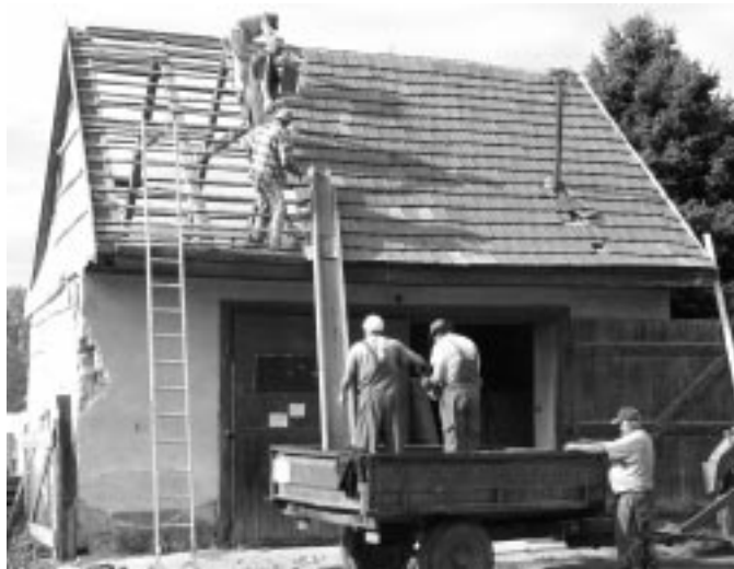
A tűzoltószertár bontása után kezdődhet az utca felőli épület-rész (konyha és étterem) alapozása