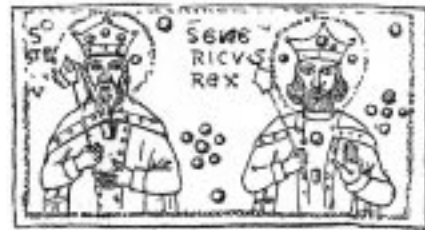
Szent István és fia, Szent Imre

SZENT ISTVÁN KIRÁLY INTELMEI IMRE HERCEGHEZ X. A KEGYESSÉGRŐL ÉS AZ IRGALMASSÁGRÓL, VALAMINT A TÖBBI ERÉNYRŐL