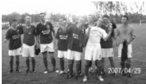
Fejér Megyei Labdarúgó Szövetség AGARDI TERMÁL Megyei II. osztály 2008/2009