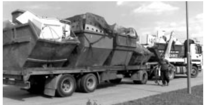
Öt konténernyi hulladékot gyűjtöttek össze a gyerekek

A Fejér Megyei Közgyűlés Környezetvédelmi és Vidékfejlesztési Bizottsága által támogatott Szelektív Hulladékgyűjtési Verseny II. fordulójában az I. fordulóhoz képest duplájára nőtt a résztvevő intézmények száma, közel megduplázódott a hulladék mennyisége is, és 3 ezer fővel emelkedett a szelektíven gyűjtő gyermekek létszáma. Az akció keretén belül összesen kb. 255 ezer kg újrahasznosítható hulladékot gyűjtöttek össze az intézmények. Az egy főre jutó, szelektíven összegyűjtött hulladékmennyiség, az összes hulladékfajta együttesen tekintve a Kajászói Általános Iskolában volt a legmagasabb: 314 kg/fő.