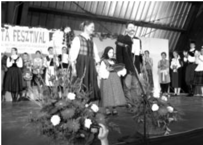
Domak Anikó képei: 1. díjátvétel, 2. Parázs zenekar

* Május 10-12. a XII. MÉTA Fesztiválon, koreográfiai versenyen Balatonbogláron a „B” korcsoportban 2. díjat nyertek az alapfokú képzésben résztvevő táncosaink, 39 gyermek, saját zenekarunk kísért a Parázs vonós banda.