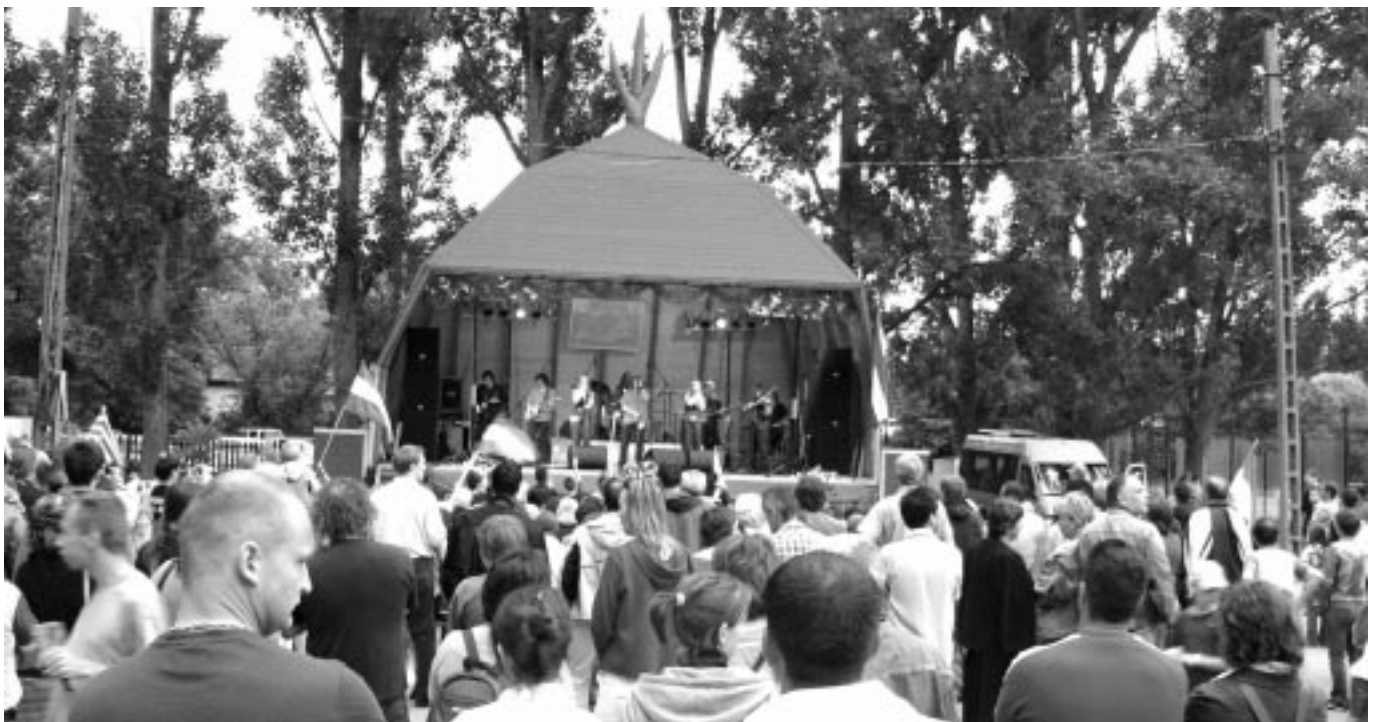
Kormorán koncert 2008. június 6-án, a megújult szabadtéri színpadon