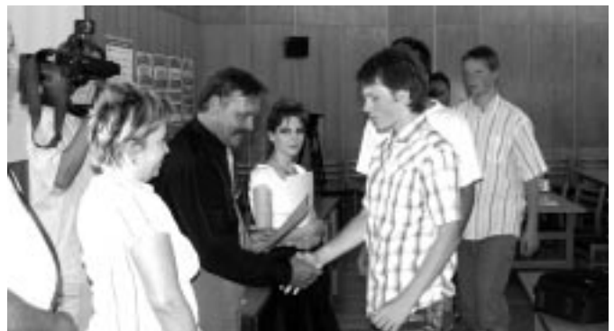
A díjat a hetedikes fiúk vették át a Megyeháza Réz termében