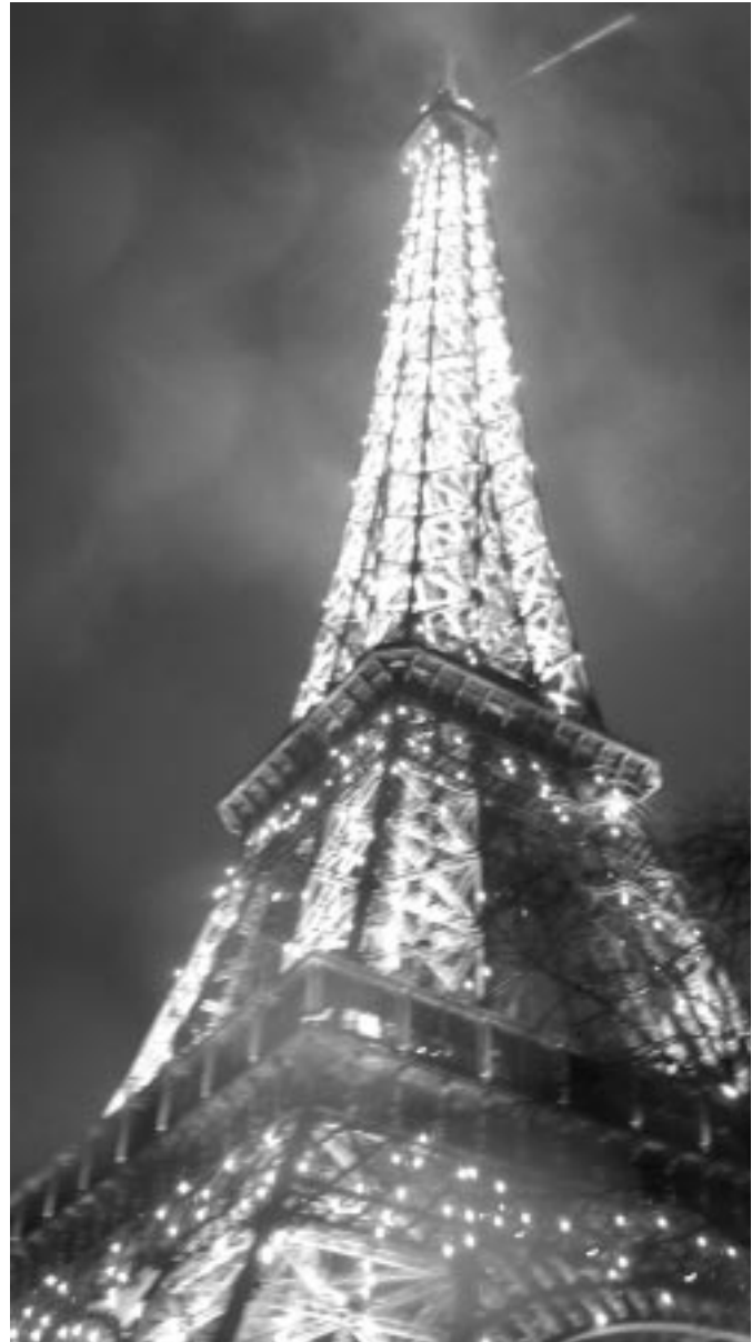
Eiffel torony.

Az utolsó morzsák elfogytával a kivilágított Eiffel torony és város látványa kárpótolta a csúcsporgalomban töltött órákért.