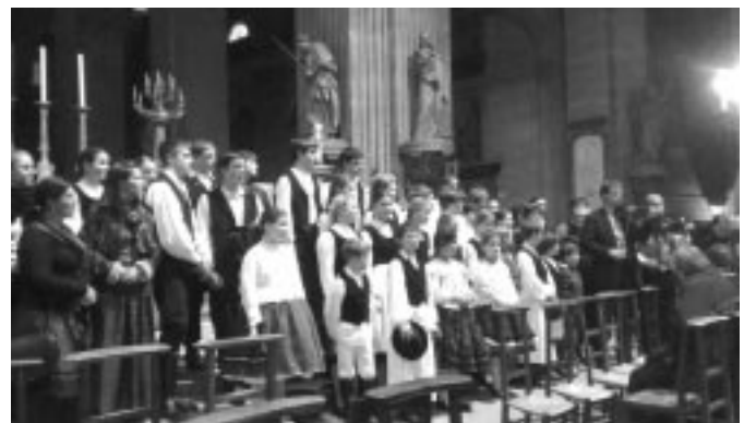
A St. Sulpice templomban.

Ebéd után irány Párizs, Rue Bonaparte. Magyar Intézet. Helyszíni szemle után a közeli St. Sulpice székesegyházba vountunk, a gyerekek népviseletben, ahol kórusba rendeződve népdalokat, a Boldogasszonyanyánkat, Himnuszunkat énekeltek el. Megható pillanatok voltak. A lehetőséget a Mardi Hongrois, a Párizsban élő magyarok szervezetének köszönhetjük.