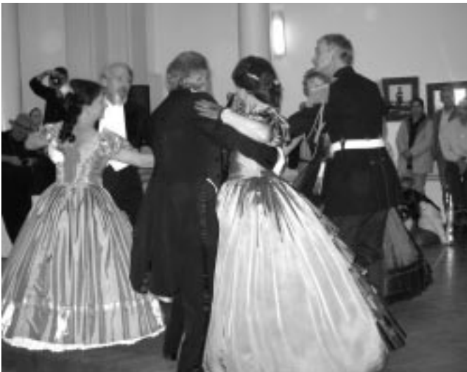
Francia négyes.