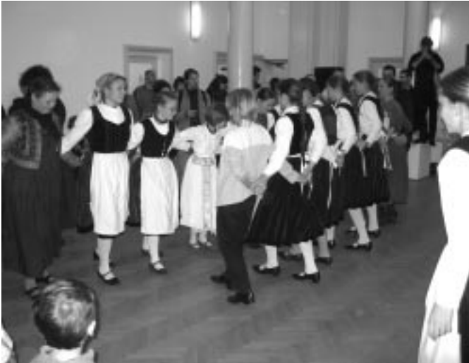
Moldvai sortánc.