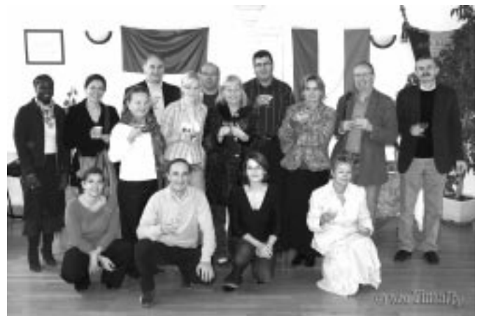
Fogadás a polgármesteri hivatalban.