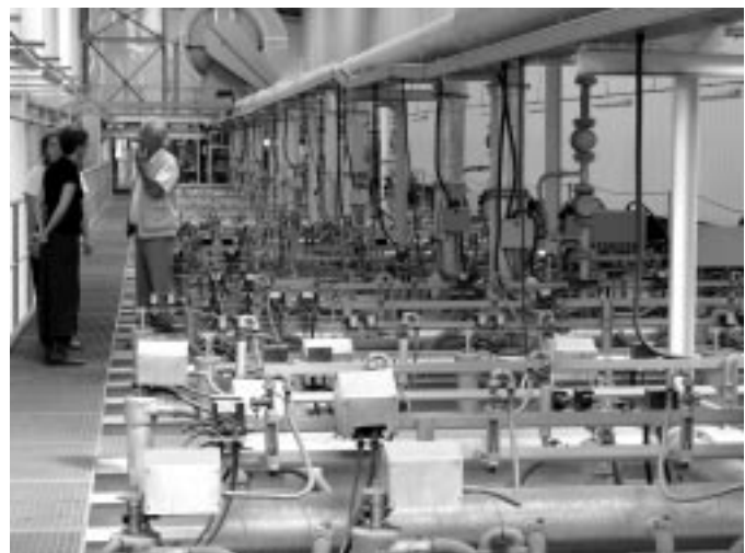
Az égetőkemence tetején