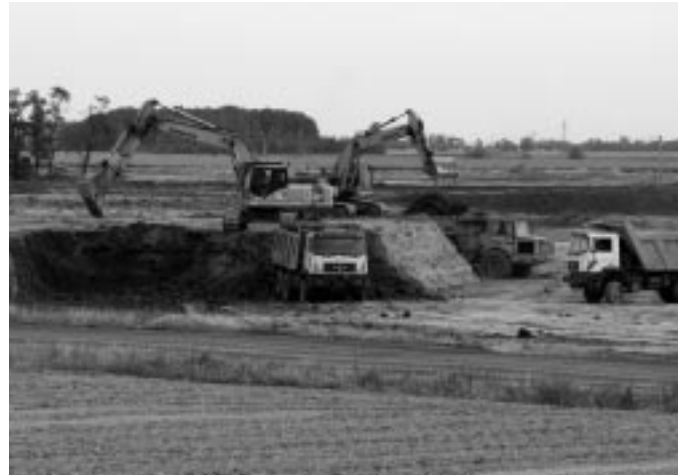
Külszíni bányászat markológépekkel és teherautókkal