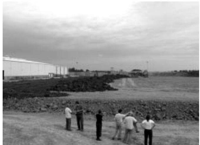
A gyár és a takarásában lévő agyagdepó