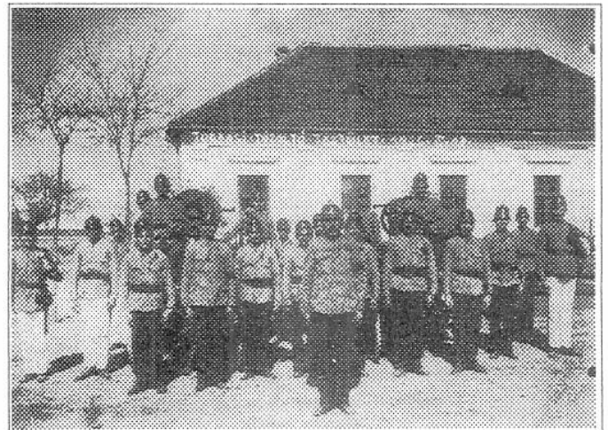
A Tordasi Tűzoltó Testület 1925-ből