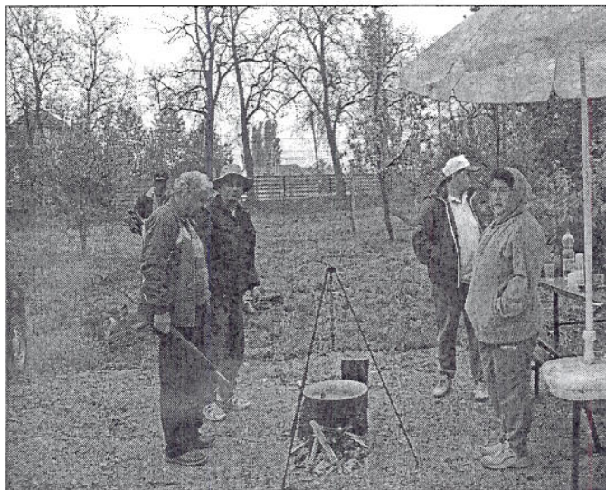
(Folytatás a 4. oldalon)