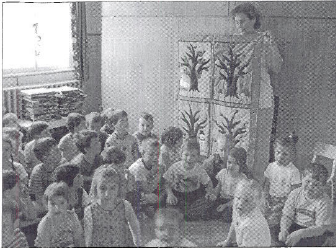
A foltvarró kör tagjainak ajándéka az óvodásoknak