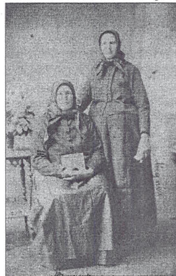
Popelka és Kisné

Aki ennek az élménynek részese volt, az eredeti magyar népviselet tisztelőjévé vált, a „magyar ruhát” szívesen hagyja a feledésnek.