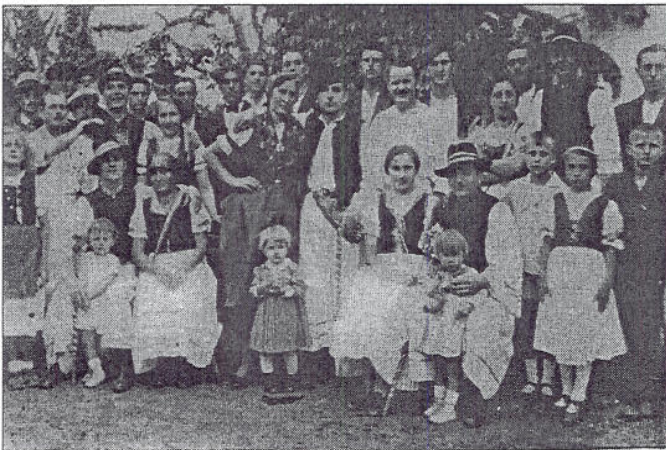
Tordasi színjátszók „magyar” ruhában

A magyar ruhának nevezett öltözet nem népviselet, hanem kreált öltözet. A Trianoni Békeszerződés következtében harmadára csonkolt ország meggyötört lelkű, magyar önérzetében mélyen megaláztatottá vált.