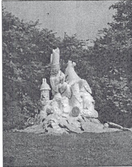
1. és 5. oszlop: kidőlt és több darabra töredezett. Szent Istvántól datálódik, az (Folytatás a 2. oldalon)

A szoborcsoport közepén ágaskodó ősmagyar lovas, mely a magyar történelem viszontagságos eseményei közepe- pette is győzedelmeskedik. Ezt az alakot fogja körbe 11 emlékoszlop, amely honalapításunktól kezdődően 1-1 évszázadot jelképez.