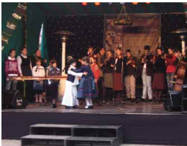
Tordasi diákok a Vörösmarty téren