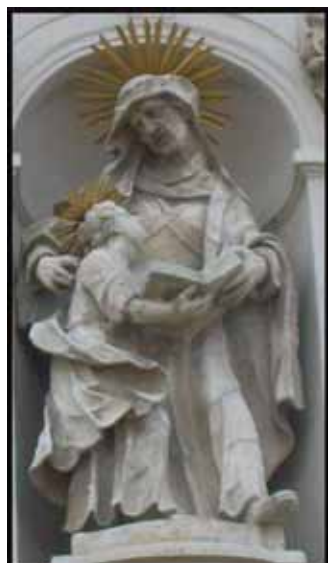
Budai Szent Anna szobor (Batthyány tér)