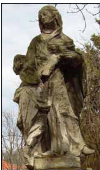
Tordasi Szent Anna szobor