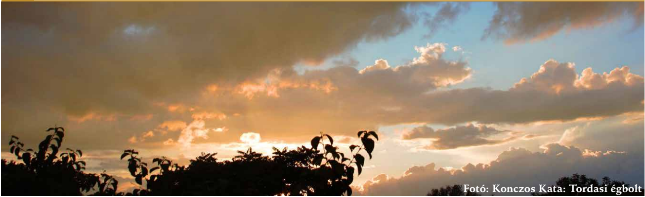
Fotó: Konczos Kata: Tordasi égbolt